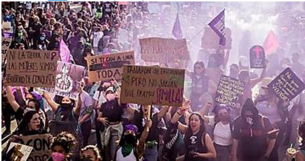
Mujeres marchan en las calles de Ciudad de México el 8 de marzo de 2022.

La mayoría de sus advertencias fueron lanzadas, sin embargo, muchas horas antes de que el grito de hartazgo llegara a la Avenida Reforma: "No somos una, no somos